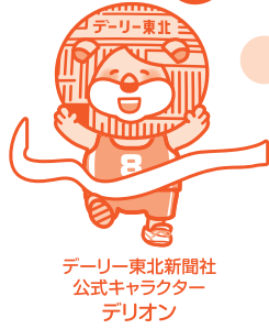
デーリー東北新聞社 公式キャラクター デリオン

全国有数の水揚量を誇る八戸漁港、うみねこが舞う蕪島、 そして三陸復興国立公園種差海岸を眺望するマラソンコース。 潮風薫る初夏、八戸のさわやかな風とともに走りませんか？ 日本陸連公認大会となります。(ハーフ、10kmが日本陸連公認コース)